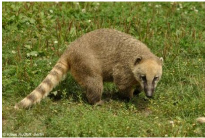
South American coati