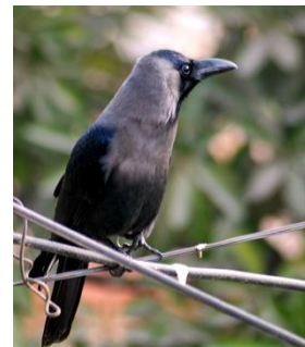
Indian house crow