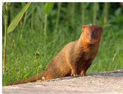
Small Asian Mongoose