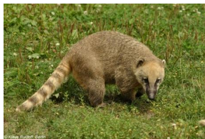
South American coati